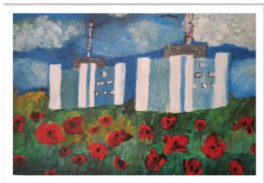
“АЕЦ Козлодуй” - рисунка на Далия Михайлова, 11 г.